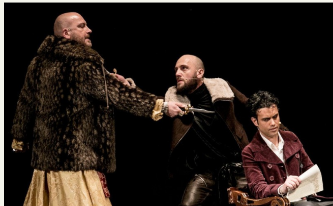
Una scena dallo spettacolo

Difficile rispondere in breve a questa domanda: è una questione vecchia quanto il teatro, la gestione è ignota ancora a tanti, a tutti forse. Questa continua ricerca della risposta, della scoperta, è il lavoro continuo che tende ad una fusione tra il reale e l'immaginario. Come asseriva Louis Jouvet, alla fine di una lunga riflessione: "La scoperta non l'ho fatta, continua la ricerca".