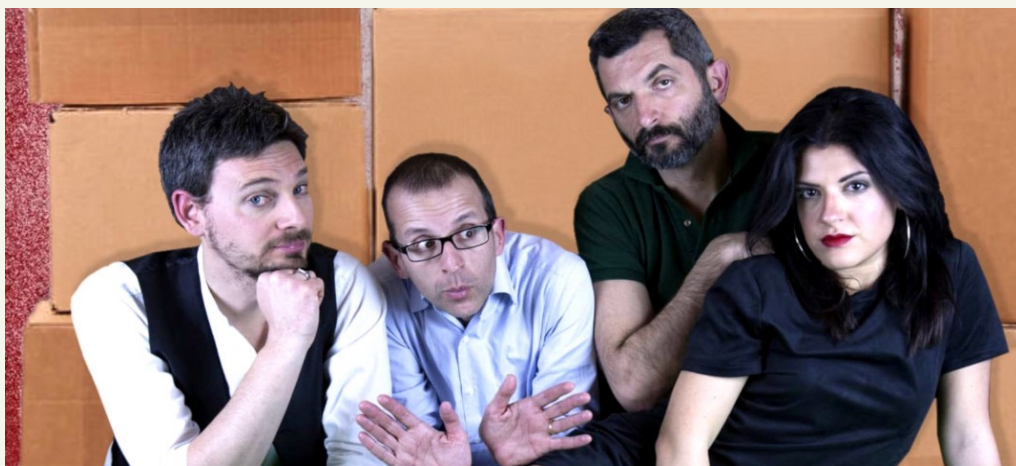
Il cast dello spettacolo "Nient'altro che la verità"

Forse qualche esperienza di collaborazione non andata troppo a buon fine... ma se è stato il prezzo per poter un giorno arrivare a esibirci in un palcoscenico così importante come quello di Pesaro, allora va bene così!