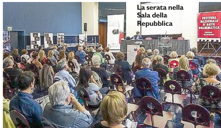
La serata nella Sala della Repubblica

ri della manifestazione, ma si è anche soffermato sulle linee programmatiche dell'amministrazione, in particolare sulla necessità di affiancare all'attività industriale, che ha caratterizzato gli scorsi decenni, un deciso impegno a favore della cultura che a Pesaro deve diventare anche motore economico. Impegno, quindi, per investimenti nel settore culturale anche d'intesa con la Regione Marche e grande attenzione, quindi, anche al Festival dei Gad. Il direttore artistico, Cristian Della Chiara, ha illustrato sintetica-