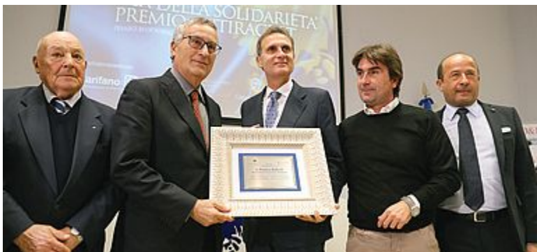
La premiazione del Procuratore Nazionale Antimafia, Franco Roberti