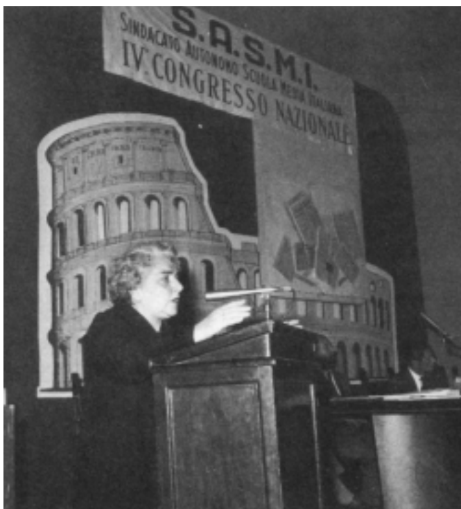
Lina Merlin durante un intervento al IV Congresso Nazionale del Sindacato Autonomo Scuola Media Italiana, a Roma, nell'aprile del 1960.

Il dibattito fu lungo e intenso. Quell'ultima seduta io la seguivo di lontano perché avveniva alla Camera, ormai in Senato la legge era passata. Qualcuno ancora si opponeva, ma debolmente, come quando un'epidemia sta perdendo la