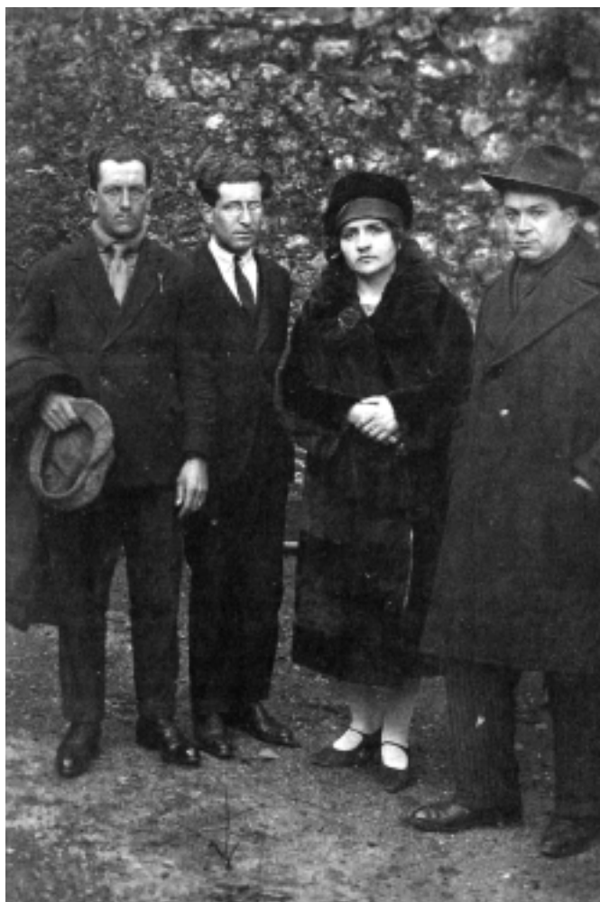
Lina Merlin durante il confino in Sardegna, con alcuni compagni